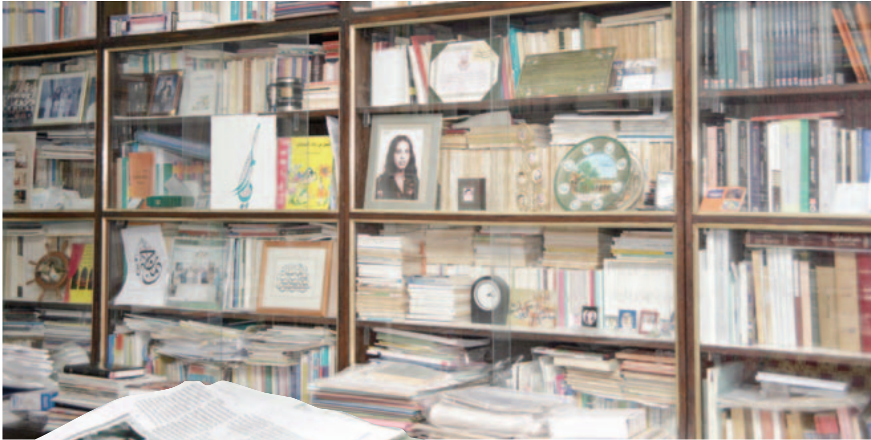
■ مكتبة المناعي.. الكتب أخذتني إلى الأرشيف