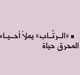
■ «الرشاب» يملأ أحياء المحرق حياة

يصف المناعي مكتبة خاله في قوله "كانت مكتبته تحوي العشرات من الكتب الحديثة في مجال اللغة