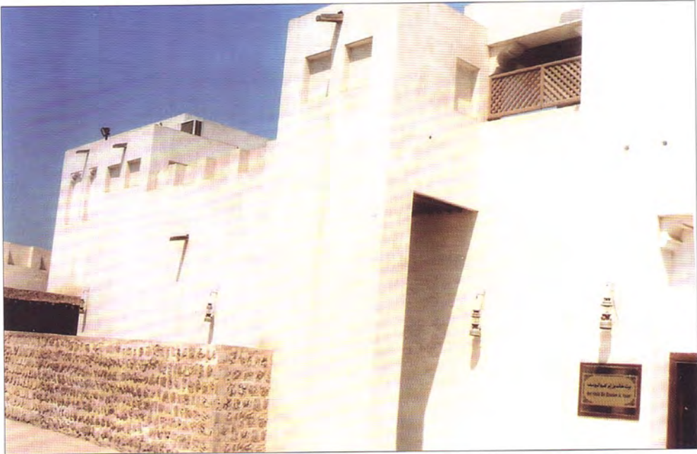
بيت خالد إبراهيم اليوسف - الشارقة